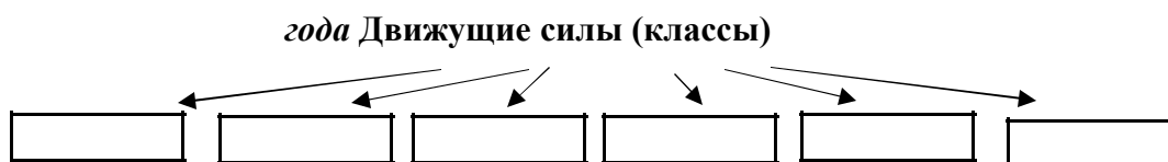
Схема. Движущая сила Февральской революции 1917 года

Класс-гегемон (класс-руководитель данной революции): _____